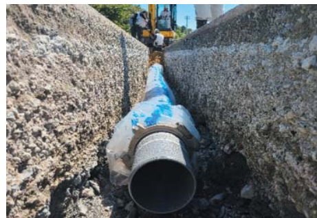
相馬市粟津字石ホ口地区