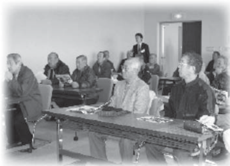
◆説明を受ける相馬市区長会のみなさん

相馬市区長会のみなさんが、平成25年2月1日に企業団を訪れ、水道水の放射能測定器(ゲルマニウム半導体検出器)の説明を受け、検査状況を確認しました。